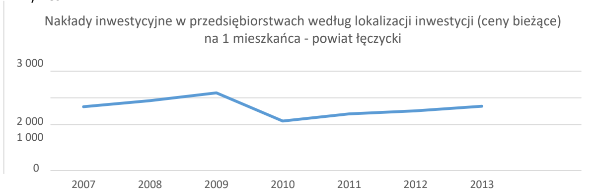
Wykres nr 2

W 2013 r. najwięcej nowych podmiotów w przeliczeniu na 10 tys. ludności zarejestrowano w stolicy województwa (114 jednostek). Najniższe wartości wskaźnika wystąpiły w powiatach: skierniewickim (43), łęczyckim (55) , pajęczańskim (57) oraz piotrkowskim (59).