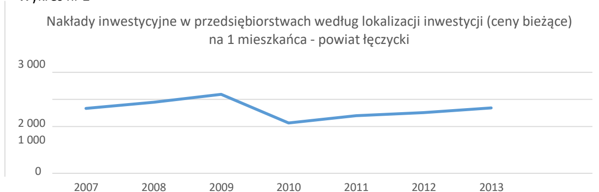
Wykres nr 2

W 2013 r. najwięcej nowych podmiotów w przeliczeniu na 10 tys. ludności zarejestrowano w stolicy województwa (114 jednostek). Najniższe wartości wskaźnika wystąpiły w powiatach: skierniewickim (43), łęczyckim (55) , pajęczańskim (57) oraz piotrkowskim (59).